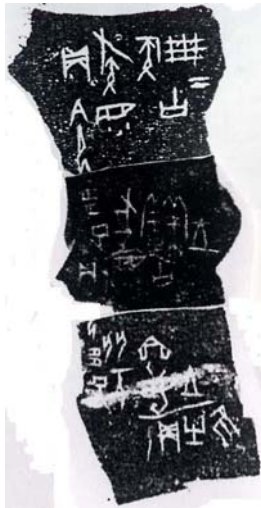
A：合 6820 正（明續 683 正）